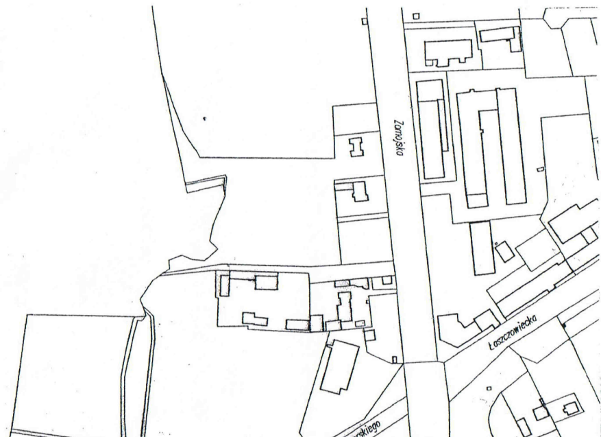
Szkic orientacyjny skala 1 : 5000

Tomaszów Lub. 05.06.2018 r. Nr. ks. rob. 14751-92/2018