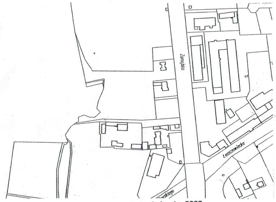
Szkic orientacyjny skala 1 : 5000

INWESTOR Miasto Tomaszów Lubelski ul. Lwowska 57, 22-600 Tomaszów Lubelski